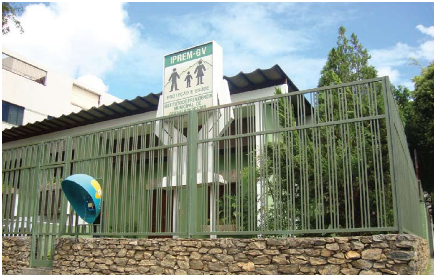
Instituto de Previdência Municipal atendeu às reivindicações dos servidores, que estavam inconformados com cobrança indevida

Mais uma vez ressaltamos o alerta a todo o funcionalismo: muito cuidado com espertalhões que estão querendo ganhar dinheiro fácil em cima dos servidores municipais, através de falsas ações judiciais. Continuem apoiando e fortalecendo o sindicato. É ele o seu representante legítimo.